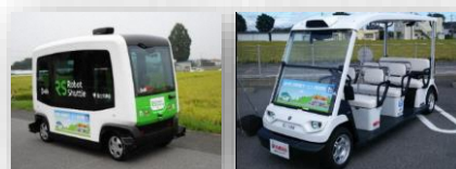
自動運転車両 (展示のみ)