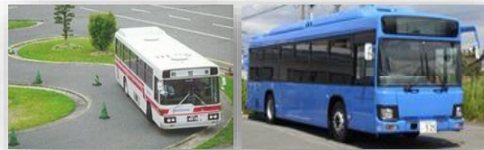
バス指導教官による模擬走行実演

日程:5/8(火)PM、5/9(水)AM・PM、5/10(木)AM (西鉄自動車学校にて) 参加費:無料(会議登録者のみ) 事前参加登録制